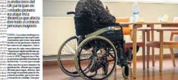
Un paciente en silla de ruedas en un hospital vitoriano.

El estudio se realizará en el Hospital de Galicia, en Ourense, y en el Hospital de Galicia, en Ourense, y en el Hospital de Galicia, en Ourense.