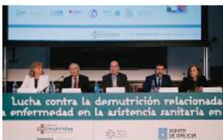
Panel de expertos durante la jornada de lucha contra la desnutrición relacionada con la enfermedad en la asistencia sanitaria en Galicia.

La Desnutrición Relacionada con la Enfermedad (DRE) se relaciona con un aumento de las complicaciones en el paciente, prolonga la estancia hospitalaria, aumenta la tasa de reingresos y la mortalidad.